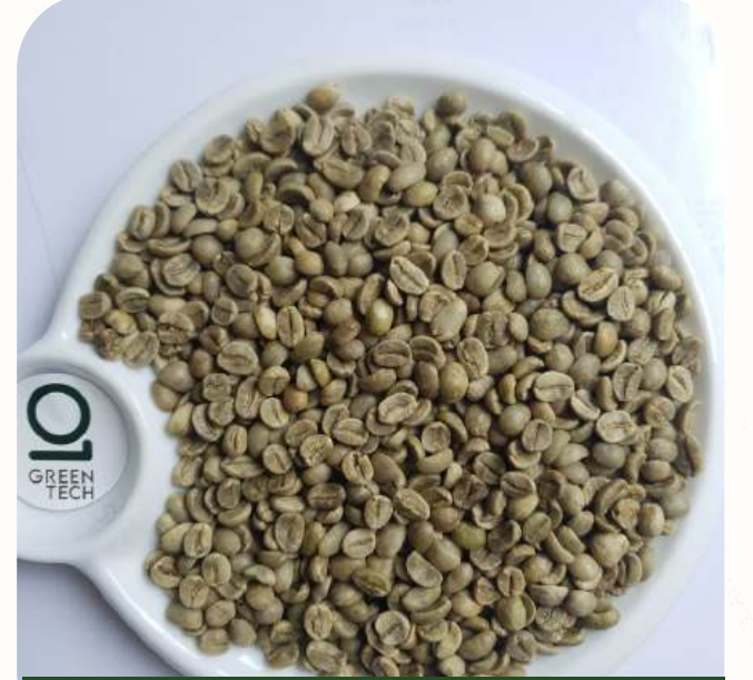
阿拉比卡 G1 - Screen 18 色选

黑豆: 最高 0.2%, 破碎豆: 最高 0.5%, 杂质: 最高 1%, 水分含量: 最高 12%