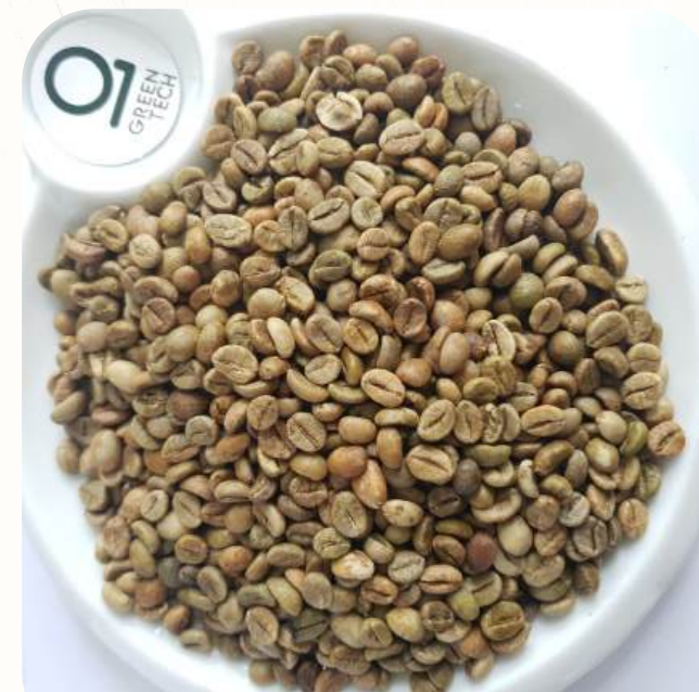
Robusta Grade 1 - Screen 18 - Color Sorted

Black beans: 2% max, Broken: 5% max, Foreign matter: 1% max, Moisture: 12,5% max, SCR 13: 90% min