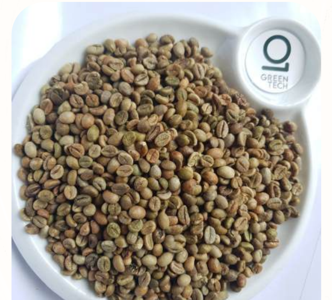
Robusta Grade 1 - Screen 16 - Color Sorted

Black beans: 0.2% max, Broken: 0.5% max, Foreign matter: 0.1% max, Moisture: 12% max