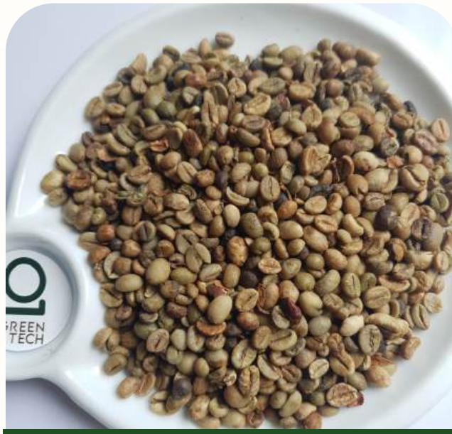
罗布斯塔 G2 - 标准

黑豆: 最高 0.2%, 破碎豆: 最高 0.5%, 杂质: 最高 0.1%, 水分含量: 最高 12%