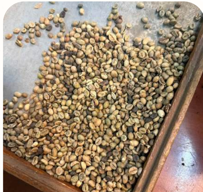
罗布斯塔 G2 - 筛选下

黑豆: 最高 2%, 破碎豆: 最高 5%, 杂质: 最高 1%, 水分含量: 最高 12.5%