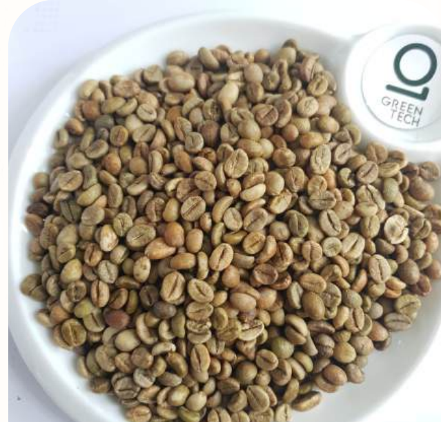
罗布斯塔 G1 - Screen 18 色选

黑豆: 最高 0.5%, 破碎豆: 最高 1%, 杂质: 最高 0.5%, 水分含量: 最高 12.5%