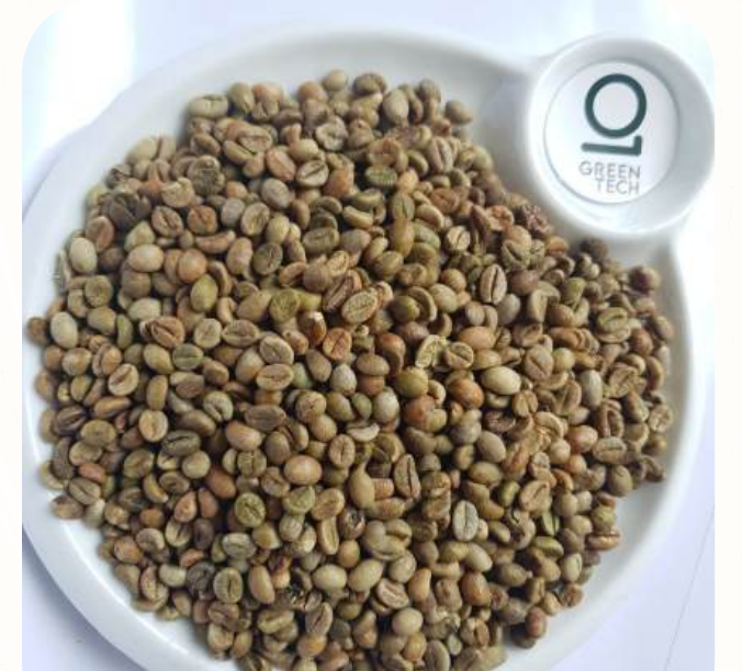
罗布斯塔 G1 - Screen 16 色选

黑豆: 最高 0.2%, 破碎豆: 最高 0.5%, 杂质: 最高 0.1%, 水分含量: 最高 12%