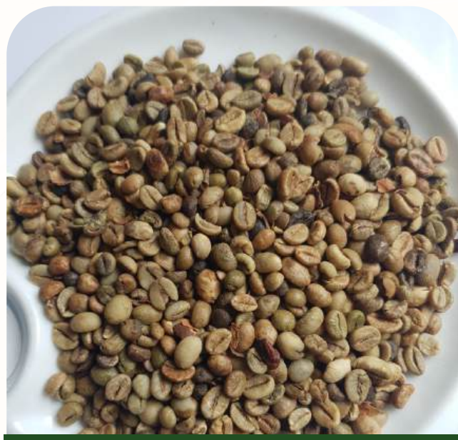
Robusta Grade 2 - Standard

Black beans: 0.5% max, Broken: 1% max, Foreign matter: 0.5% max, Moisture: 12.5% max