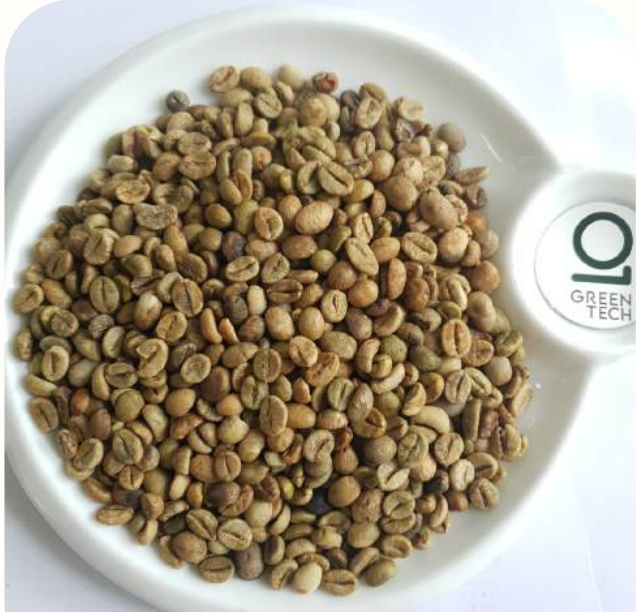
罗布斯塔 G1 - Screen 18 水洗

黑豆: 最高 0.5%, 破碎豆: 最高 1%, 杂质: 最高 0.5%, 水分含量: 最高 12.5%