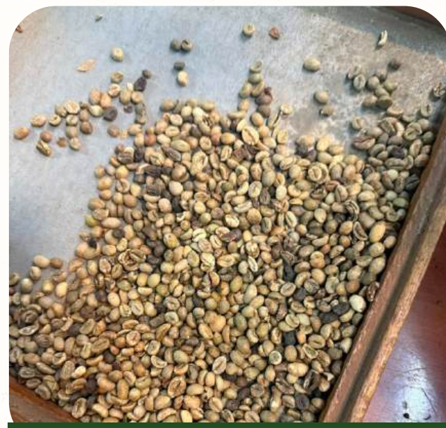
Robusta Grade 2 - Underscreen

Black beans: 2% max, Broken: 5% max, Foreign matter: 1% max, Moisture: 12,5% max