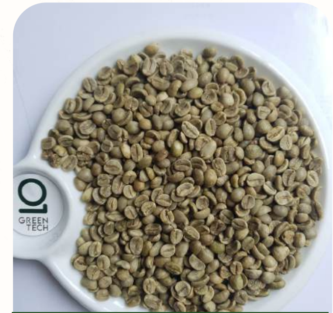
Arabica Grade 1 - Screen 18 - Color Sorted

Black beans: 0.2% max, Broken: 0.5% max, Foreign matter: 0.1% max, Moisture: 12% max