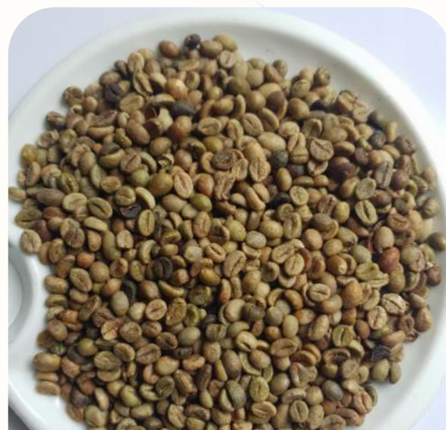
Robusta Grade 1 - Screen 16 Cleaned

Black beans: 0.5% max, Broken: 1% max, Foreign matter: 0.5% max, Moisture: 12.5% max