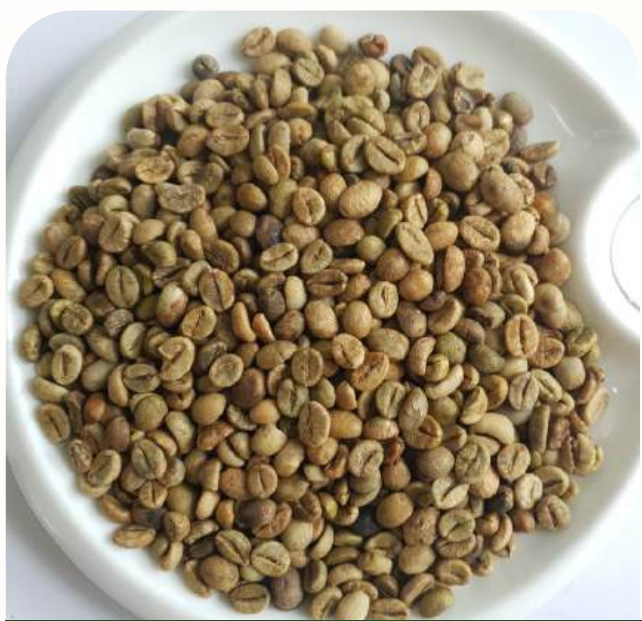
Robusta Grade 1 - Screen 18 - Cleaned

Comprehensive Export Support Full documentation, certifications, and logistics for smooth, compliant shipments.