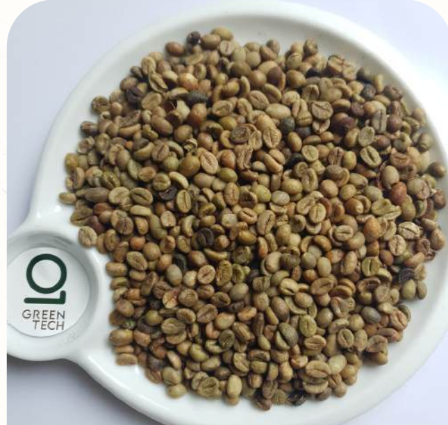
罗布斯塔 G1 - Screen 16 水洗

黑豆: 最高 0.5%, 破碎豆: 最高 1%, 杂质: 最高 0.5%, 水分含量: 最高 12.5%