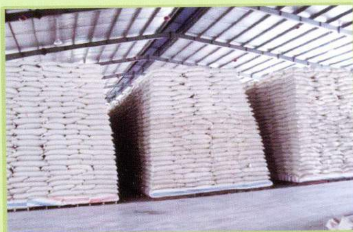
Kho hàng Warehouse