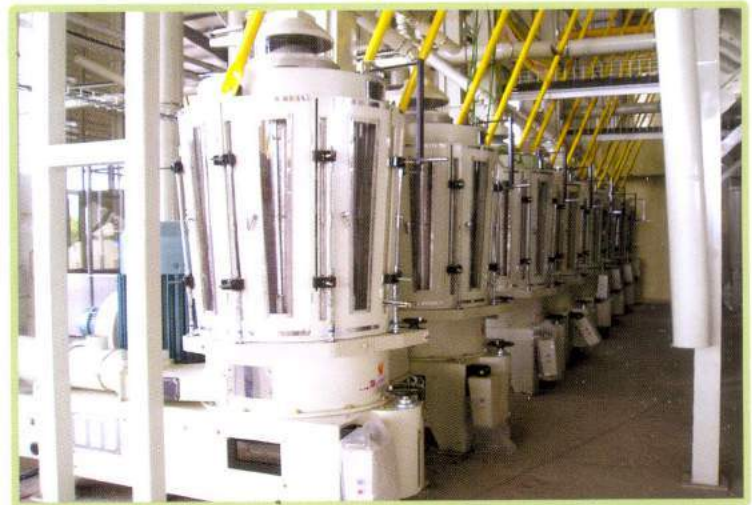
Máy xát trắng Whitening system