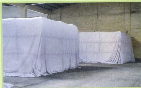
Xông trùng sản phẩm Fumigation