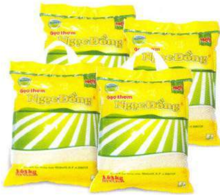
Gao Ngọc Đồng - Sản phẩm đạt tiêu chuẩn GlobalG.A.P và HACCP

Ngoc Dong Rice - Meeting standard of GlobalG.A.P and HACCP