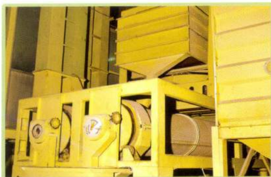
Hệ thống phân loại hạt Length grader