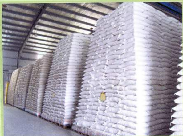
Kho hàng Warehouse