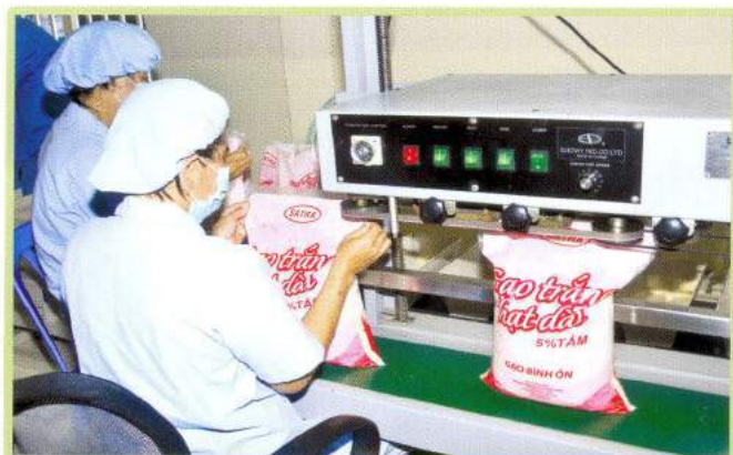
Máy đóng gói Packing machine