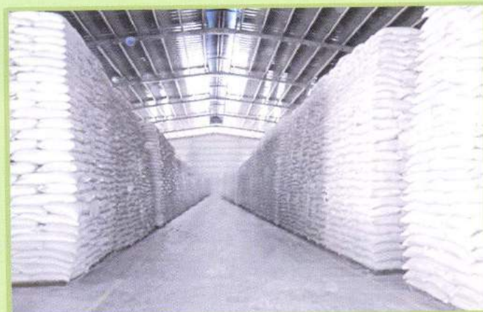
Kho hàng Warehouse