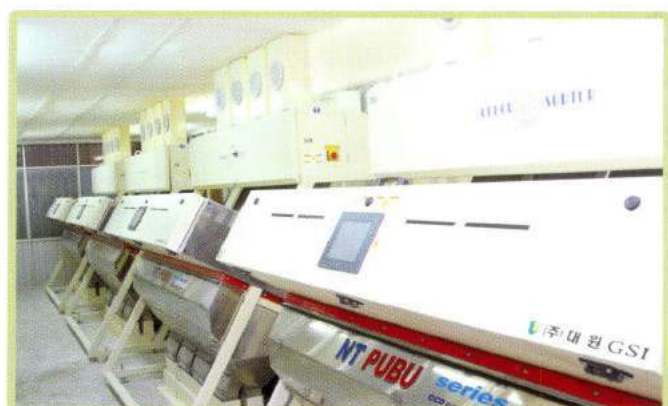
Máy tách màu Color sorter