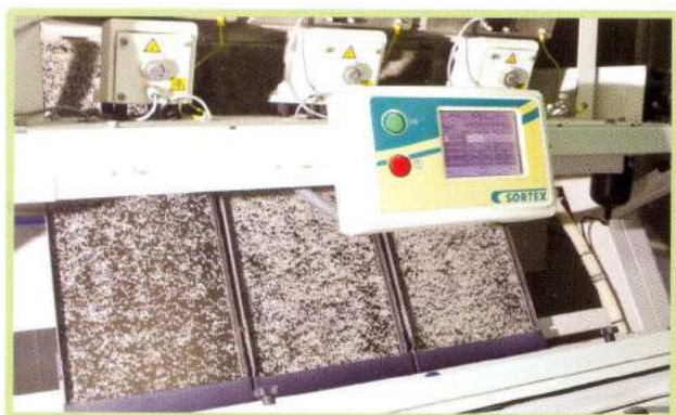
Máy tách màu Color sorter