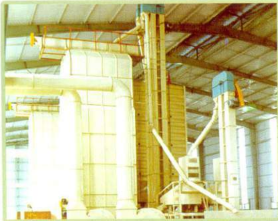
Máy sấy lúa Paddy dryer