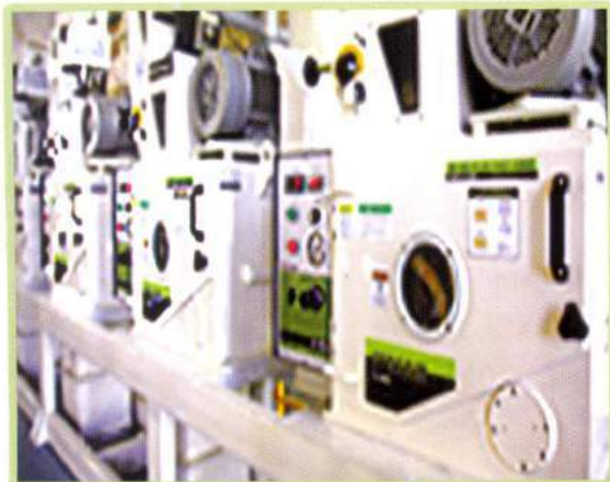
Máy bóc vỏ lúa Paddy husker