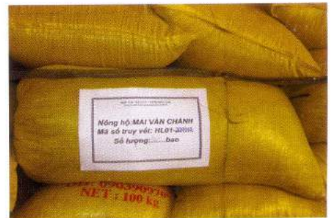
Truy vết nguồn gốc sản phẩm Traceability