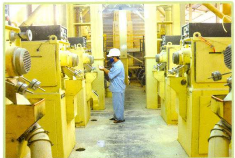
Máy lau bóng Polishing system