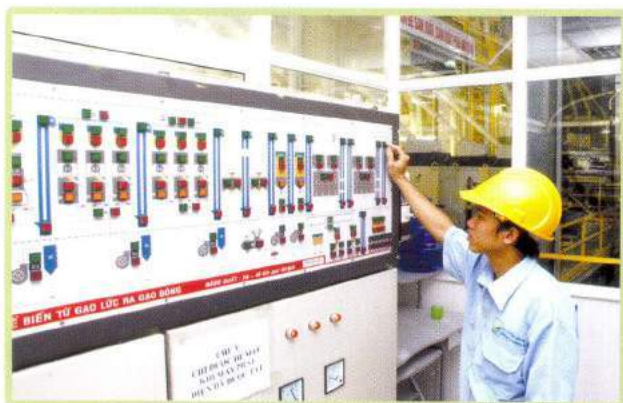
Trung tâm điều khiển hệ thống thiết bị Operating center